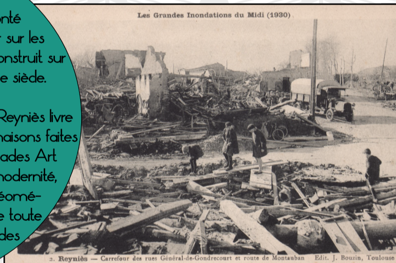
Les Grandes Inondations du Midi (1930)

Au terme de trois ans de reconstruction, Reyniès livre en 1933 son nouveau visage. De solides maisons faites de béton et de pierre affichent leurs façades Art Déco, style résolument tourné vers la modernité, privilégiant lignes droites et formes géométriques, mais néanmoins empreint de toute la fantaisie caractéristique de l'art des "années folles".