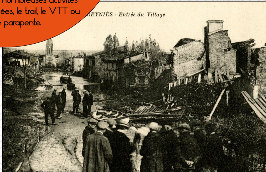
REYNIÈS - Entrée du Village