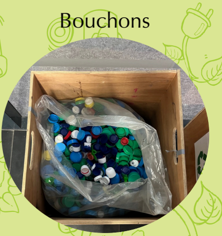
Apport volontaire à la BU Paul Sabatier :

Densifier le maillage des poubelles : lieux de vie et de passage