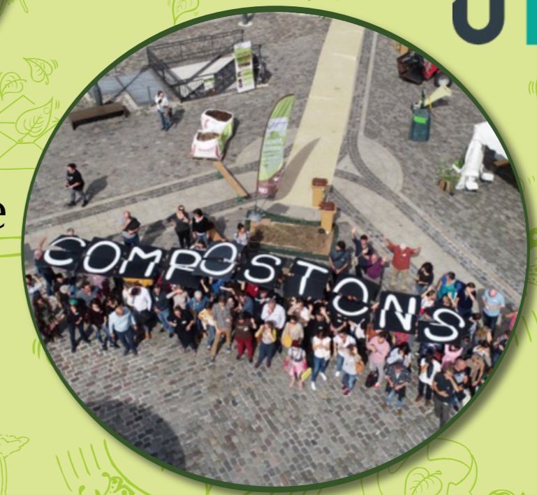
université de TOURS