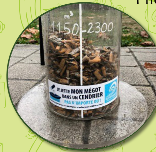
Cendrier Nudge U. Paris Nanterre